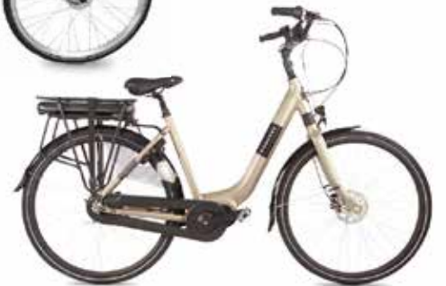
Fongers Superior 522 Wh € 2.899,- nu € 1999,-